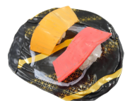
お弁当のふた →ミニチュア