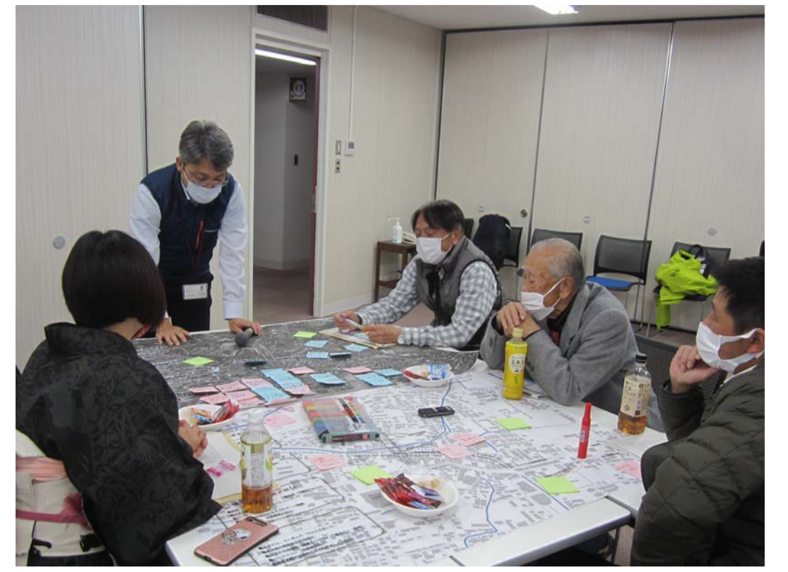
まちづくり（ワークショップ）