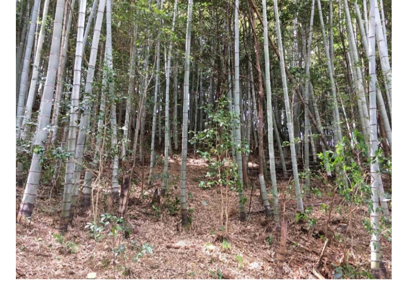
枯死木の撤去・択伐

相愛敷地内の植物調査の結果、103科370種類（6種類が希少種）の植物が確認されています（2017～2018年実施）。また高知市平野部では数が減ってしまった里山に比べ動物が今なお多く確認でき、昆虫では主に森林性と草原性のものが見られます。